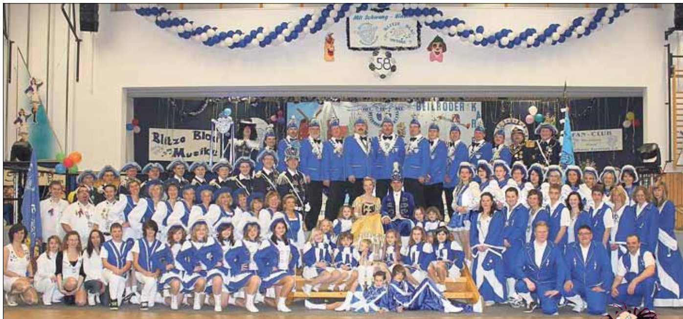
Der Beilroder Karnevalsclub in seiner 58. Saison

Die diesjährige Auftaktveranstaltung mit Prinzenwahl findet am 12.11.2011 , ab 19.59 Uhr, im neuen Narrenhauptgewölbe, der Ostelbienhalle, statt. Fans der Beilroder Narren wissen, dass an diesem Abend nicht nur die Eröffnung der Kussfreiheit auf dem Programm steht, sondern auch die Premiere des neu einstudierten Marschtanzes der Funken und Gardisten.